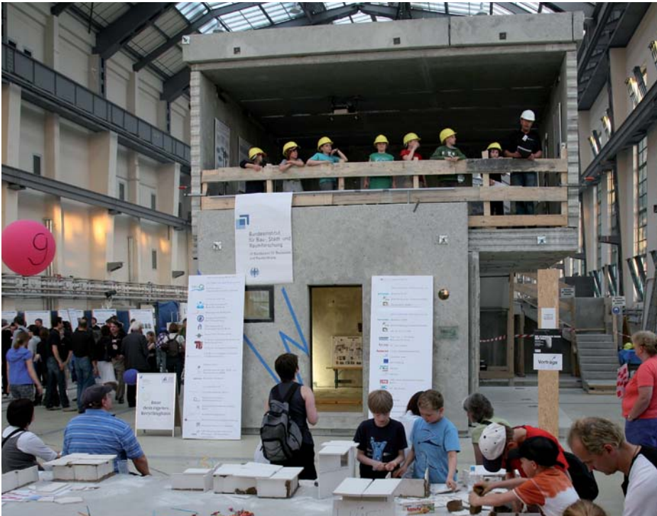
„Lange Nacht der Wissenschaft Berlin 2010“, Programm in Kooperation mit dem Bundesinstitut für Bau-, Stadt- und Raumforschung (BBSR), Interaktive Angebote, Vorträge und Experimente für Kinder und Erwachsene, Juni 2010

Alle Aktivitäten sind dokumentiert auf www.plattenvereinigung.de (— Blog).